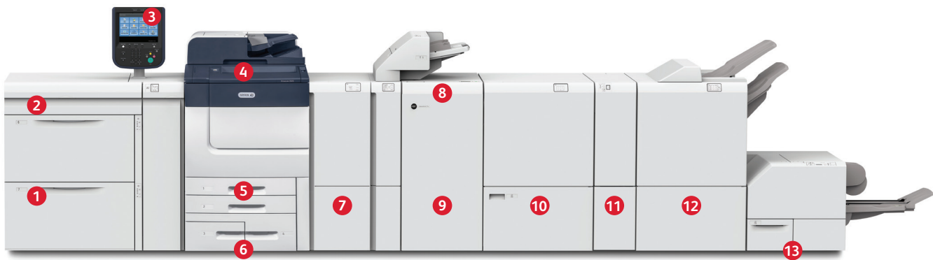
Xerox® PrimeLink® C9065/C9070-Drucker

1 Großraum-Papierbehälter für Überformate mit zwei Behältern: Für weitere 4.000 Blatt in Formaten von 182 x 250 mm (B5) (bis zu 350 g/m 2 ) bis 330 x 660 mm (bis zu 220 g/m 2 ).